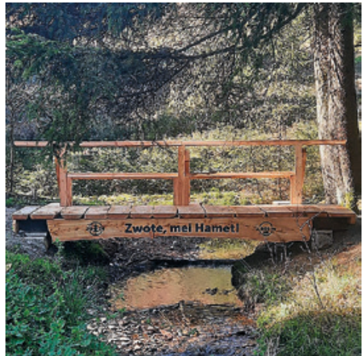
Freigelegter Wasserlauf der Zwota Quelle oberhalb von Zwotalental

des Heimatvereines und erfreuen sich stetig steigender Beliebtheit bei allen Wanderfreunden jeder Generation. Seit wenigen Tagen ist auch der Lehrpfad im Hüttenbachtal wieder gut erreichbar und kann gerne bewandert werden. Die vom Stadtbauhof neu errichtete Brücke, gleich am Eingang des Tales, ist es auf jeden Fall wert, besichtigt zu werden. Viel Spaß beim Wandern im „Zwoater Land“ wünscht Ihr Heimatverein Zwota