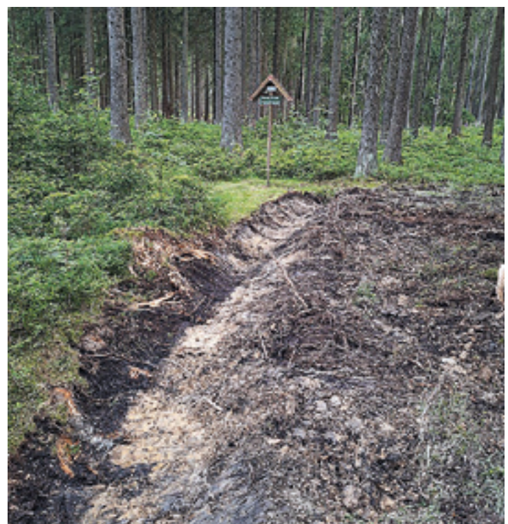
Neue Brücke über den Hüttenbach