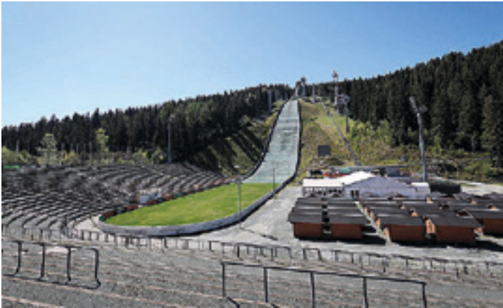
Die Sparkasse Vogtland Arena bei bestem Wetter im Sommer.