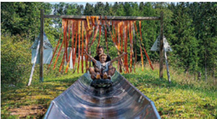
Eine Familie bei einer Fahrt mit der Sommerrodelbahn in Mühlleithen.

Konstanze Schneider Pressesprecherin VSC Klingenthal e.V.